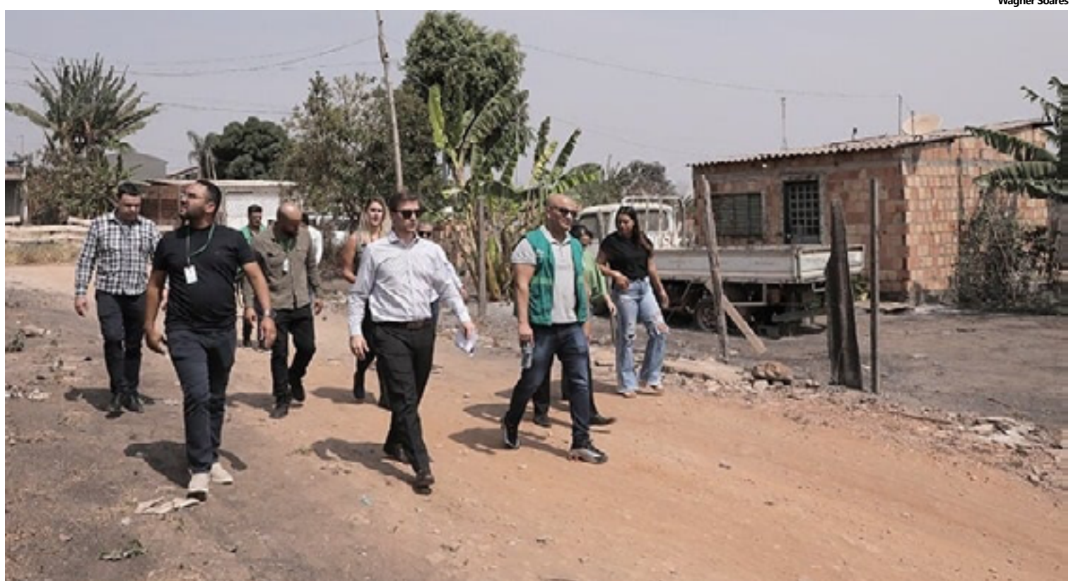
A visita ocorreu para que a desocupação da área, que é de preservação ambiental, seja feita forma consensual com os moradores

“A presença da comissão em Águas Lindas, numa ocupação que envolve tantas famílias, traz consigo a oportunidade do diálogo, de serem ouvidos os ocupantes, a defensoria pública, o MPGO, o poder público municipal e os proprietários para que possamos, juntos,