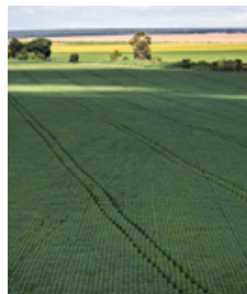
Em 2023, a soja ocupou 54,1% do total de área plantada, aumentando 11,4% na comparação com 2022

A produção de tomate foi de 1,2 milhão de toneladas em 2023, com aumento de 25,1% em relação a 2022, mantendo o Estado como o maior produtor da cultura no País. Entre os municípios, as altas foram observadas principalmente em Cristalina (2,4%), Silvânia (292,1%) e Morrinhos (1,8%), que são, respectivamente, os três maiores produtores brasileiros.