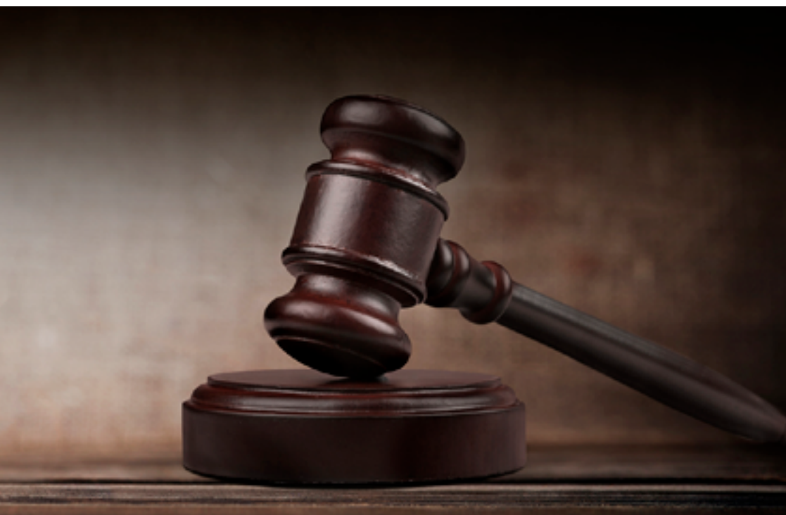
O nome do acusado não será revelado, pois o processo permanece em segredo da Justiça até o trânsito em julgado

A denúncia aponta que o casal mantinha um relacionamento conturbado, pois o denunciado era extremamente