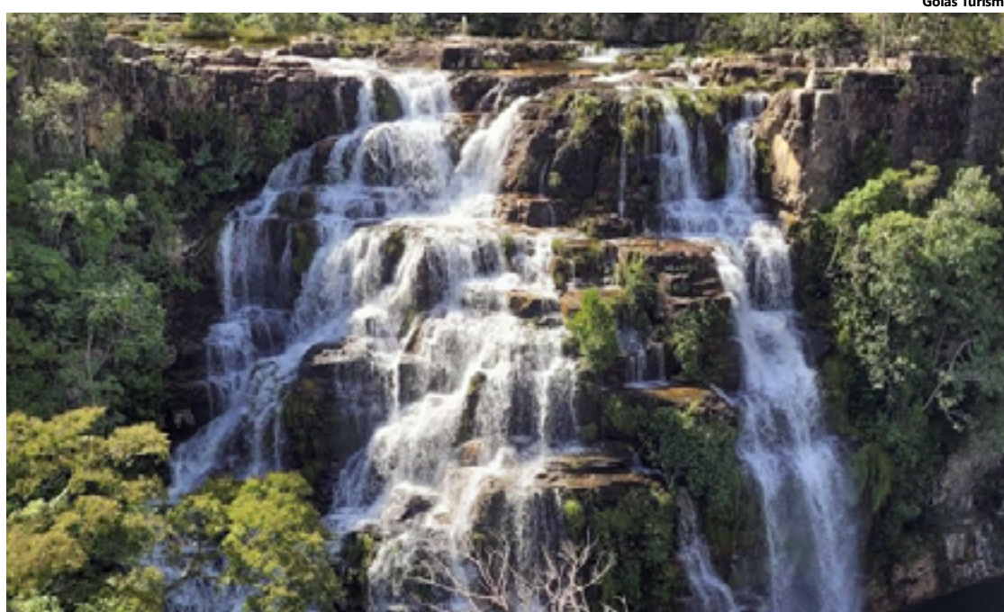
Volume de serviços de turismo em Goiás cresceu 5,8% em julho de 2024, na comparação com o mesmo período de 2023

Com os resultados, Rio Grande do Sul (12,2%), Goiás (3,9%), Minas Gerais (2,1%) e São Paulo (0,3%) apontaram