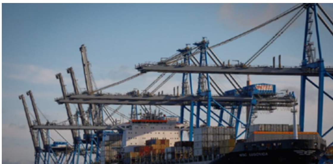
O lançamento do edital ocorreu durante a Feira Internacional de Comércio Exterior do Brasil Central (Ficomex), em Goiânia

O Peiex, um programa da ApexBrasil, visa qualificar e orientar empresas goianas, especialmente micro e pequenas, para que possam iniciar a exportação de seus produtos e serviços de forma planejada e segura. Em Goiás, o programa será executado com o apoio