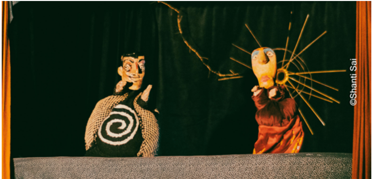
Ao ser abordado pelas autoridades, o suspeito inicialmente negou que tivesse atropelado a cadela, alegando que apenas "bateu" no animal

é realizada com recursos da Lei Paulo Gustavo do Distrito Federal. Após a estreia em Alexânia, a montagem segue para o DF, com apresentações em escolas e bibliotecas públicas, na Universidade de Brasília e no Espaço Cultural Renato Russo.