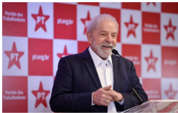
Lula da Silva: aumenta aprovação entre os pobres e diminui entre os ricos

A pesquisa também perguntou aos participantes, diretamente, se aprovam ou não a gestão do presidente Lula. Dentre os ouvidos, 49% aprovaram e 45% desaprovaram, enquanto 6% não responderam. No levantamento anterior, 50% aprovavam e 44% desaprovavam.