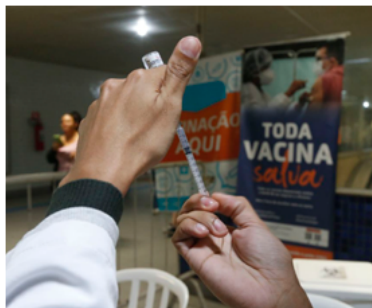
Maioria das ocorrências graves ocorrem entre crianças e adolescentes de até 14 anos de idade

“Com esse quadro preocupante, é fundamental seguir recomendações como uso de máscara em locais fechados com maior aglomeração de pessoas e com menor circula-