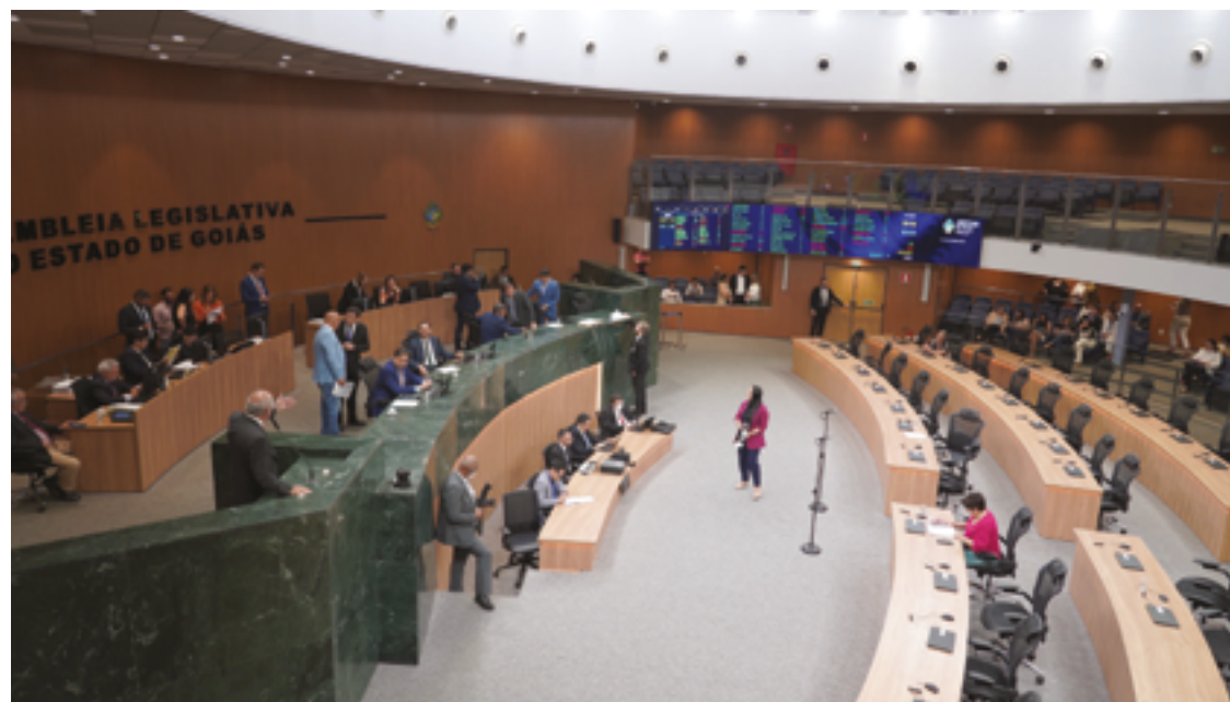
Ainda foram votados projetos que ampliaram abrangência da Lei Maria da Pena e, também, beneficiaram feiras de produtos orgânicos

“A perda gestacional, neonatal e infantil é uma realidade que afeta inúmeras famílias em todo o mundo, deixando marcas emocionais profundas e duradouras. É uma experiência que, muitas vezes, é vivenciada em silêncio, devido ao estigma