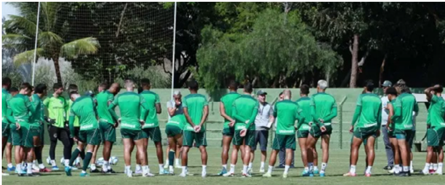
Time teve queda de rendimento nas últimas rodadas com apenas uma vitória nos últimos cinco jogos

Comparando o aproveitamento atual do time esmeraldino, que é de 45%, 33 pontos conquistados e o aproveita-