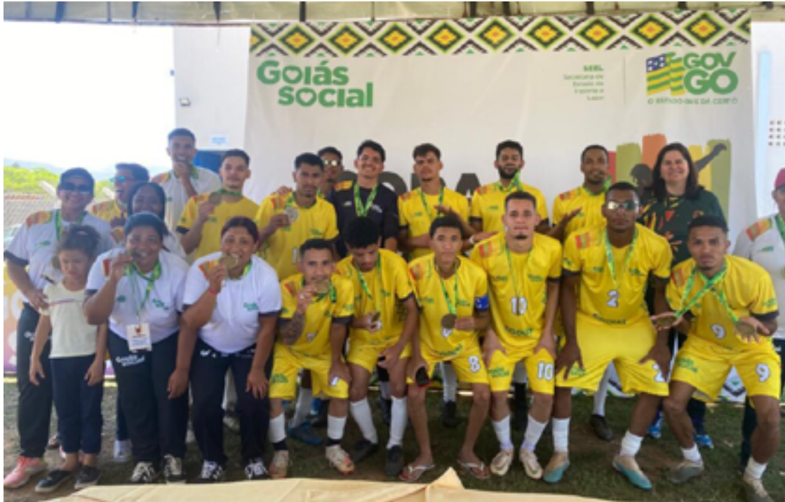
Equipe da Comunidade João Borges Vieira, de Uruaçu, foi a campeã da etapa regional de Niquelândia

Uma das ações do programa Goiás Social, a Copa Quilombola é organizada pelo Governo de Goiás, por meio da Secretaria de Estado de Esporte