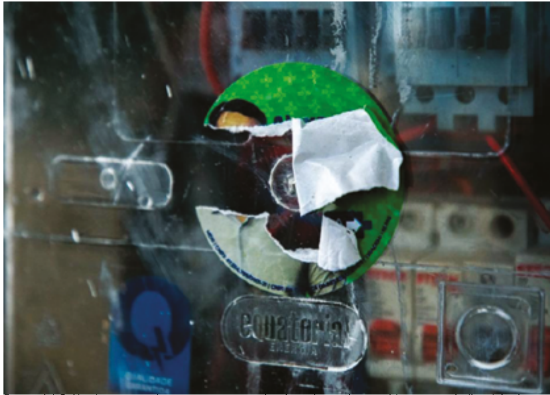
Equatorial Goiás alerta que colocar cartazes nestes locais pode ocasionar acidentes e prejudicar leituristas

"A leitura por média pode, muitas vezes, gerar um acúmulo de consumo e refletir no valor acima do esperado na fatura, além disso, o cliente pode ter o fornecimento suspenso