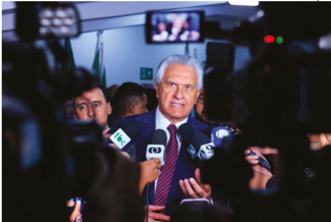
Caiado: “Não assumi governo para dizer amém, ficar assistindo enquanto o Estado é incendiado por criminosos”

O governador demonstrou preocupação com a movimentação de organizações criminosas, que se articulam para praticar incêndios com objetivo de desvalorizar o patrimônio. Em seguida, tentam adquirir a área afetada