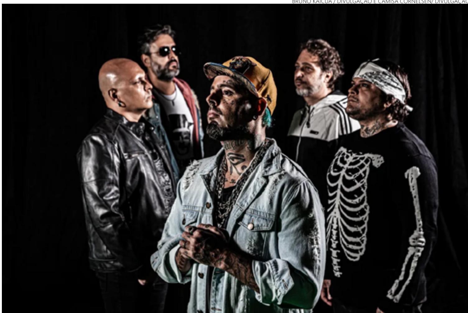
Detonautas Roque Clube: banda carioca leva ao Goiânia Arena repertório gravado na memória afetiva dos fãs