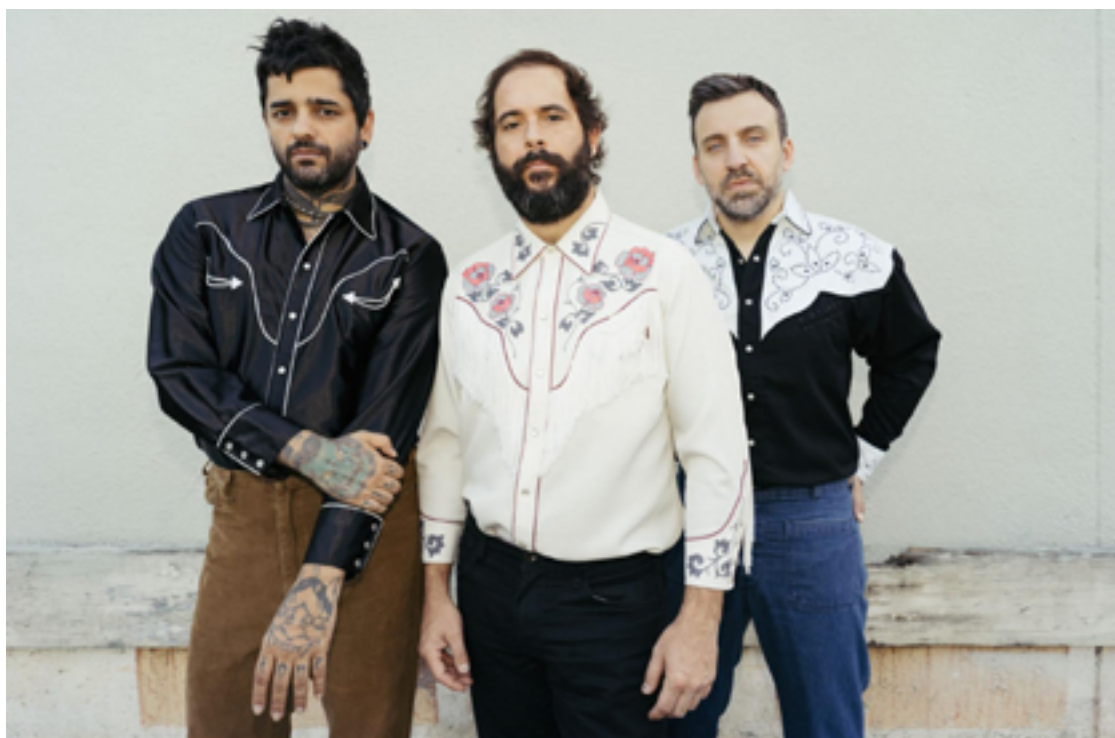
Fresno: grupo celebra 25 anos de carreira na Capital goiana

nautas fez toda uma geração crescer cantando seus refrões ou tocando em guitarras distorcidas seus riffs barulhentos. Se pensar na saúde do rock nacional durante os anos 90, quando Planet Hemp, Nação Zumbi e Charlie Brown tentaram nadar contra a maré do axé, o grupo mostrou que power chords e bom texto eram atrativos.